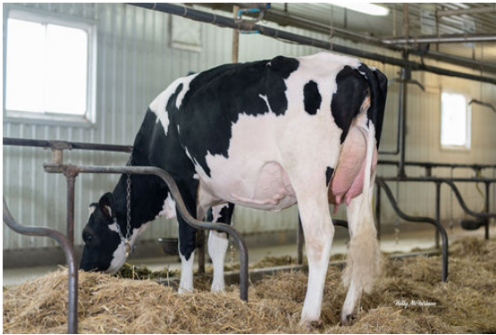
FIELDHOLME APTITUDE ALEXIS