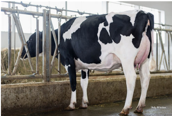
SPENCROFT APTITUDE LUCIBOMB