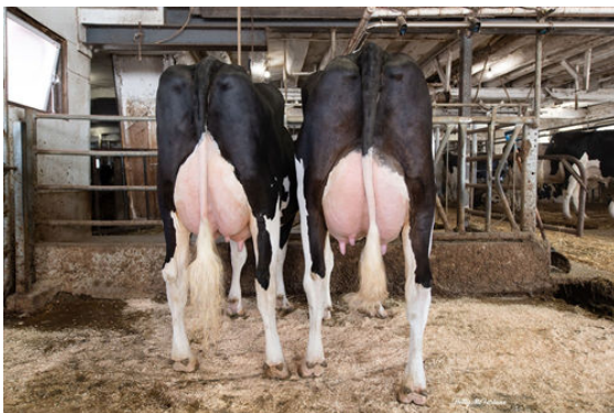
APTITUDE DAUGHTER GROUP